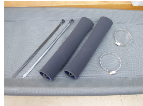
タイラップとステンバンド付属