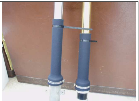
下部は、お助けマンに掴まれても大丈夫なようにホースバンド止めしてください。