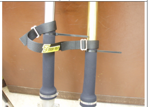
余ったタイラップのしっぽは、スタックベルトの下がり止めに活用してください。